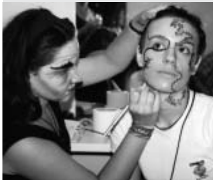
NA SLICI: Kreativne radionice na dječjem festivalu u sklopu međunarodnog volonterskog kampa, Madrid 2002

Festivali (muzički, kazališni, multikulturalni...) na kojima volonteri/ke pomažu pri postavljanju ili uklanjanju pozornice i dekoracija, čišćenju tijekom trajanja, prije i poslije festivala, itd. Često volonteri/ke imaju priliku i sudjelovati na festivalu te izraziti svoju kreativnost i vještine. Neki kampovi su organizirani tako da na njima sudjeluju samo umjetnici (umjetničke kolonije).