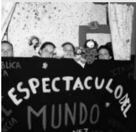
NA SLICI: Kreativne radionice za djecu (kazalište lutaka) u sklopu međunarodnog volonterskog kampa u Alcobendasu, Španjolska 2001.

Socijalni projekti. Primjeri ovog rada uključuju brigu za starije ljude, organiziranje slobodnih aktivnosti za osobe s posebnim potrebama, vođenje igraonica i kreativnih radionica za nezbrinutu djecu, itd.