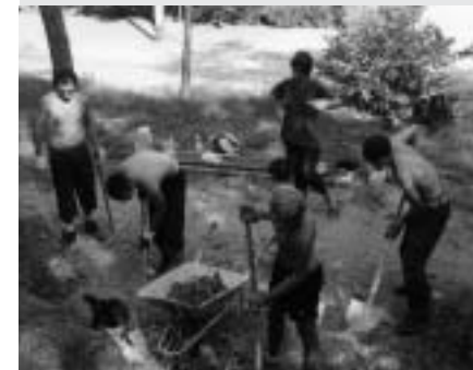
NA SLICI: Ekološko-radni kamp. Postavljanje klupica i čišćenje okoliša u gradskom parku, Buzet 2004.

Projekti vezani uz okoliš koji mogu uključivati čišćenje plaža, jezera, rijeka, sadnju drveća, raščišćavanje šumskih puteva, itd.