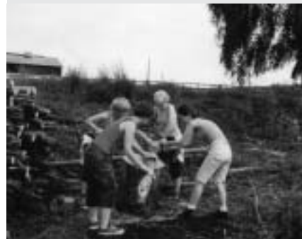
NA SLICI: međunarodni volonterski radni kamp u Češkoj, farma Ležnice, 2000.

Gradnja, rekonstrukcija ili renovacija zgrada, igrališta i sl., u formi fizičkog rada koji uglavnom ne zahtijeva posebne vještine i znanje.