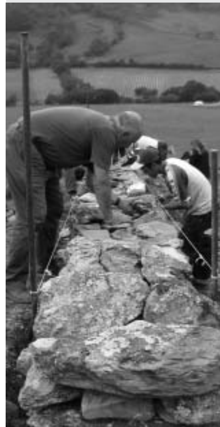
NA SLICI: Restauratorski međunarodni volonterski kamp, Wales 2004.

Edukacijski / studijski projekti. Na ovakvim kampovima glavni radni zadatak nije fizički posao već umjesto toga volonteri/ke sudjeluju u radio-nicama, diskusijskim grupama, predavanjima, studijskim posjetima, i sl. na specijalnu temu koja može biti okoliš, Europska politika, rasizam, socijalna integracija, izgradnja mira itd.