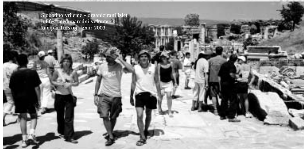
Slobodno vrijeme - organizirani izlet u Efes, međunarodni volonterski kamp u Turskoj, Izmir 2003.

cija između volontera/ki i voditelja/ica. Potaknuti volontere/ke da govore o svojim poteškoćama i prijateljski pristup najbolji su način da im se pomogne da se integriraju u grupu.