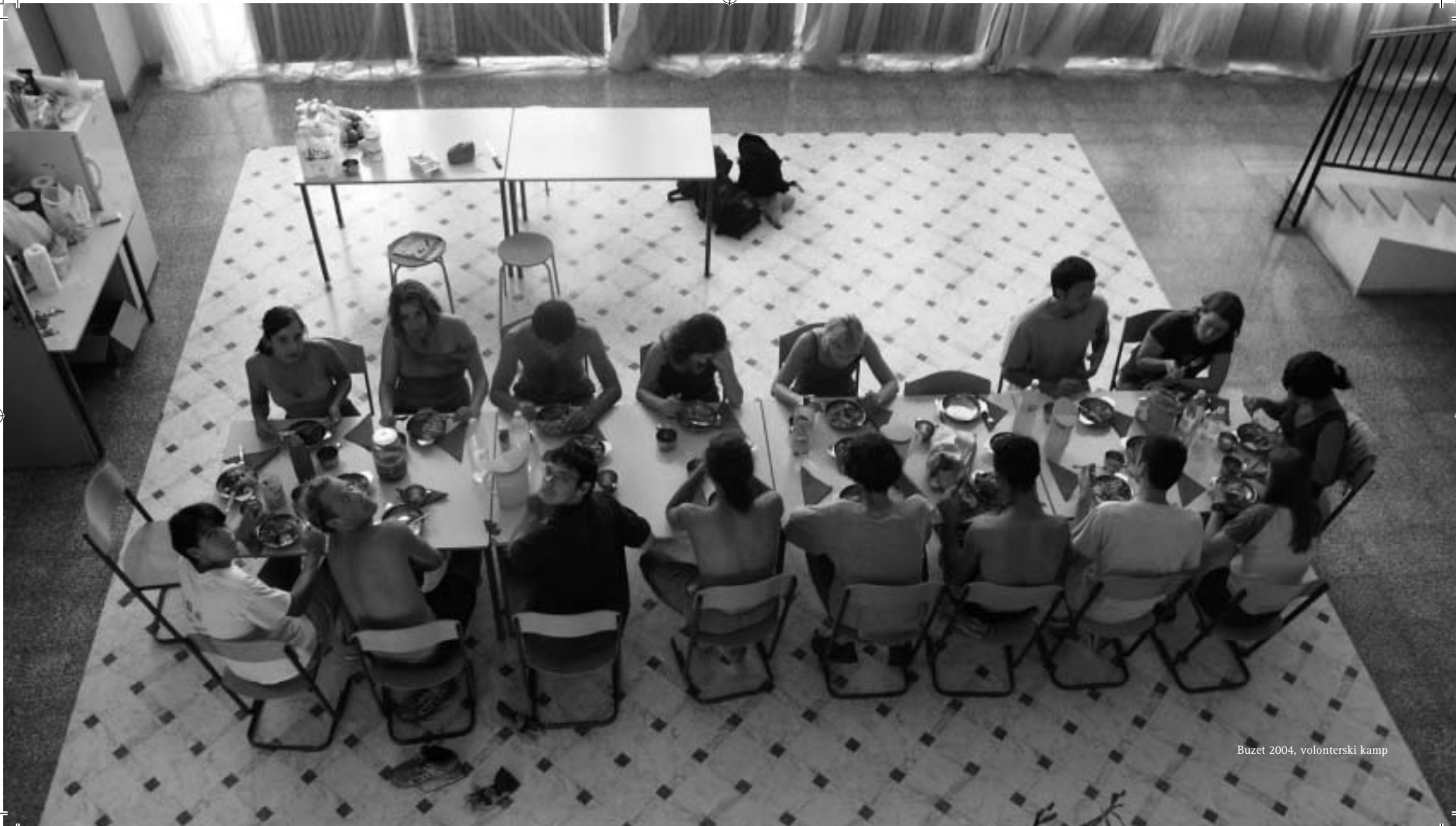
Buzet 2004, volonterski kamp