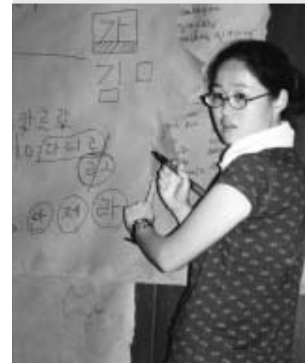
NA SLICI: Edukacijski međunarodni volonterski kamp, Koprivnica 2004

Edukacijski / studijski projekti. Na ovakvim kampovima glavni radni zadatak nije fizički posao već umjesto toga volonteri/ke sudjeluju u radio-nicama, diskusijskim grupama, predavanjima, studijskim posjetima, i sl. na specijalnu temu koja može biti okoliš, Europska politika, rasizam, socijalna integracija, izgradnja mira itd.