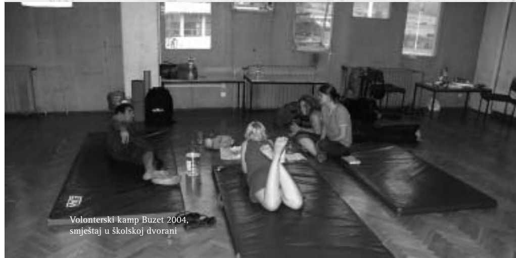
Volonterski kamp Buzet 2004, smještaj u školskoj dvorani

Sav posao koji se na kampu obavlja (rad, kuhanje, čišćenje...) volonteri/ke dogovorom dijele međusobno po principu da svatko doprinese u skladu sa svojim sposobnostima, talentima, željama ili afinitetima.