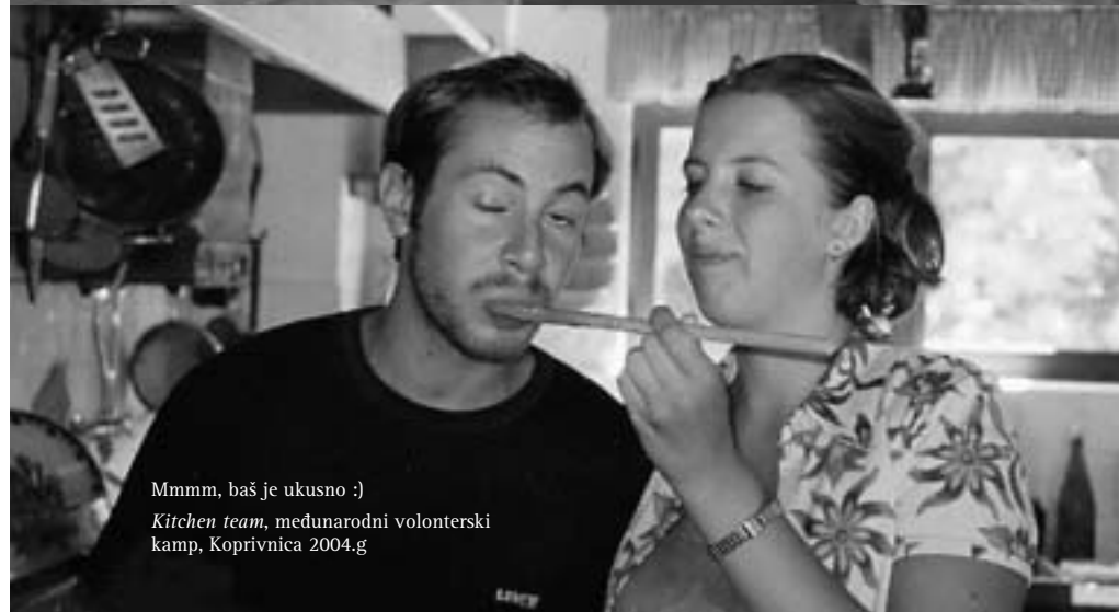
Mmmm, baš je ukusno :) Kitchen team, međunarodni volonterski kamp, Koprivnica 2004.g